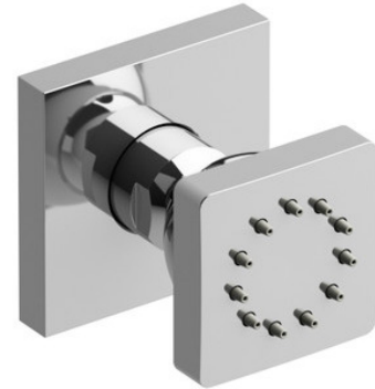
Jet de corps 1 fonction